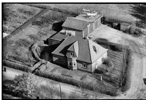
Egetoft set fra luften i starten af 1950'erne.

Hvordan klarer Omnibussen til Hald sig? – Vi må nu nøjes med at køre med een Vogn, men foreløbigt gaar der ogsaa, idet vi kan tage Gummien fra et par opklodsede Vogne vi har. – Hvordan ordnes Fordelingen af Dækkene? – Hvert Amt faar tildelt et antal Dæk. Viborg Amt har faaet 9 Dæk; men vi aner ikke noget om, hvorlænge det varer, inden vi igen faar nogle. – Hvordan fordeles de saa? – Foreningen og Rutebiludvalget uddeler dem saaledes, at de der trænger haardst, faar først. Situationen er alvorlig for hele Landet, og det varer sikkert saa længe, inden Rutebiltrafikken gaar i staa mange Steder, hvor man ikke mere kan tage Dæk fra andre, opklodsede Vogne.”